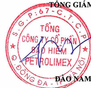
ĐẠO NAM HẢI